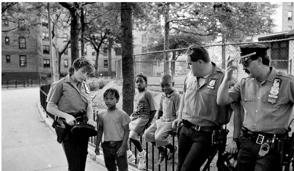
Queensbridge Houses en 1992