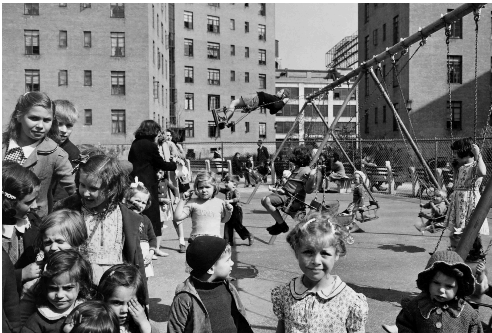
Queensbridge Houses en 1940