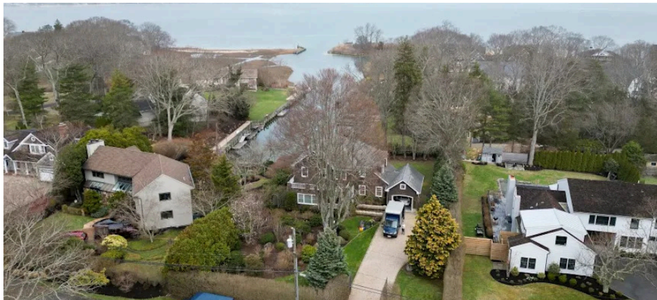
3 El hogar de $2.8 millones de dólares de un ejecutivo de NYCHA en Long Island

Mientras todo esto ocurre día tras día, los administradores de NYCHA vienen al trabajo e ignoran los problemas de los residentes. Los superintendentes se pasan el día sentados sin dar golpes, cobrando sobornos y asegurándose de que no completen las reparaciones necesarias. Los altos jefes de NYCHA—personas que ganan salarios de más de $200,000—vienen a sus oficinas desde sus mansiones millonarias en Long Island y Staten Island. Y los ejecutivos de bienes raíces—los que conspiran para apoderarse de los complejos de NYCHA—jamás ponen un pie en los proyectos. Viven en comunidades privadas en Connecticut y Westchester. Sus hijos asisten a colegios privados. Tienen niñeras, chefs privados, clubes de campo, clubes náuticos, y clubes del tráfico sexual (basta con buscar información sobre los hermanos Alexander).