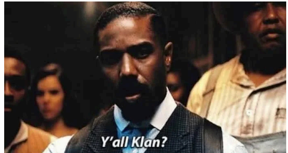
Cuando las empresas de bienes raíces llaman a la puerta...

Con cada pelea a puñetazos, cada silbido, cada sobredosis, cada trozo de basura tirado por la ventana, se da un paso más hacia la limpieza urbana. Es otra generación de personas negras arrojadas al desplazamiento, o atrapadas en un barrio que las está matando. Son dos círculos del mismo infierno estadounidense.