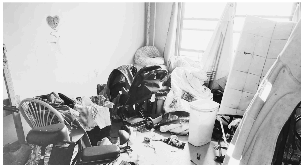
Un apartamento de NYCHA ocupado por vagabundos en 2026